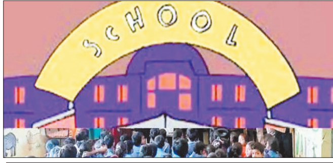
एडमिशन पर होगा परेन्ट्स का सम्मान

स्कूल के बाहर रहे विहित बच्चों के प्रवेश पर उनके अभिभावकों का स्कूल में स्वागत किया जाएगा। स्कूलों में अभिभावकों के साथ स्कूल में संचालित गतिविधियों के बारे में चर्चा की जाएगी, जिसमें प्रमुख रूप से कक्षावार, विषयखण्ड, शैक्षणिक कैलेंडर, अध्ययन अध्यापन प्रक्रिया, अभिभावक शिक्षक बैठकों, सह शैक्षणिक गतिविधियों, स्कूल में उपलब्ध सुविधाओं के बारे में जानकारी दी जाएगी। प्रवेश उत्सव की तरह ही इस बार की शिक्षा व्यवस्था भी कुछ खास है। जिले के सरकारी स्कूलों में इस शैक्षणिक सत्र नर्सरी की शिक्षा भी हासिल हो सकेगी। इससे पहले तक स्कूलों में सिर्फ पहली कक्षा से ही दाखिला होता रहा है। जानकारी का कहना है कि अब तक नर्सरी और केजी की शिक्षा के लिए अभिभावकों को निजी स्कूलों पर ही निर्भर रहना पड़ता था। नए सेंट अप से व्यवसाय उखाड़ बेहतर हो सकेगी। प्रवेशोत्सव के दौरान जनजागरूकता के लिए सरकारी स्कूलों की ओर से बोर्ड परीक्षाओं में बेहतर अंक लाने वाले विद्यार्थियों का फोटो समेत प्रचार किया जाएगा। प्रवेशोत्सव के दौरान मुख्य द्वार पर सजावट करते हुए पहली बार प्रवेश होने वाले विद्यार्थियों का स्वागत भी किया जाएगा।