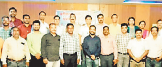
अभियंता संघ की बैठक में उपस्थित पदाधिकारी व सदस्य।

छत्तीसगढ़ राज्य विद्युत मंडल पत्रोपाधि अभियंता संघ की केंद्रीय कार्यकारिणी की बैठक महाराष्ट्र मंडल चौबे कॉलोनी रायपुर में आयोजित की गई, जिसमें जगदलपुर, अंबिकापुर, बिलासपुर, रायपुर, दुर्गा राजनांदगांव एवं कोरबा क्षेत्र के सदस्य उपस्थित हुए। कार्यकारिणी की बैठक में विभिन्न क्षेत्र से उपस्थित हुए सदस्यों के द्वारा अपने अपने क्षेत्र की समस्याएं एवं मांगों के संबंध में विचार व्यक्त किया गया। बैठक में मुख्य रूप से वितरण केंद्र उपसंभाग एवं जोन में तकनीकी कर्मचारियों की भारी कमी पर ध्यान केंद्रित किया गया जिसके कारण उपभोक्ताओं की विद्युत संबंधित समस्याओं का समय पर निराकरण न होने से उपभोक्ताओं में रोष व्यक्त हो रहा है एवं कंपनी की छवि धूमिल हो रही है। साथ ही ओ एंड एम एवं सुरक्षा सामग्री की पर्याप्त उपलब्धता न होने से फील्ड एवं पदस्थ कनिष्ठ एवं सहायक अभियंता को लाइन ब्रेक डाउन के दौरान परेशानियों का सामना करना