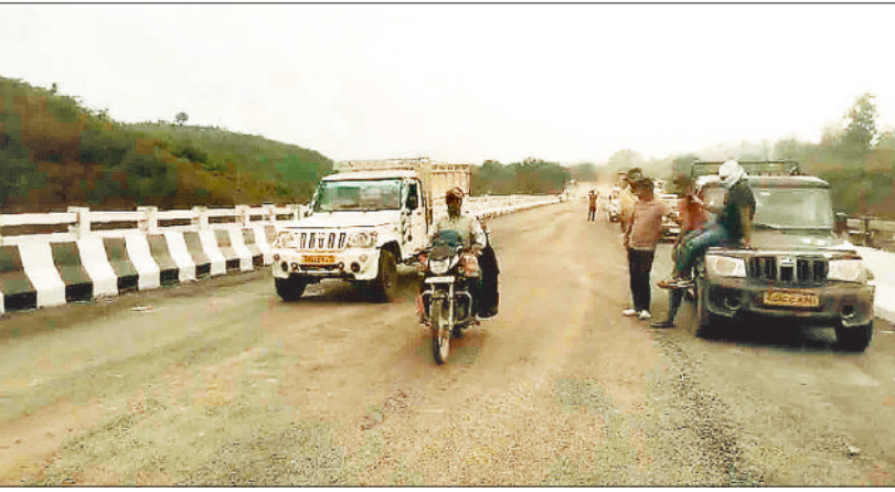
नवनिर्मित बायोडक्ट से आवागमन करते यात्री।

घाट के खतरनाक मोड़ों के कारण आए दिन होती थी दुर्घटनाएं, लगता था जाम सटे लुचकी घाट में आए दिन सड़क जाम की स्थिति निर्मित होने के साथ ही भीषण दुर्घटनाएं होने के कारण शासन ने लुचकी घाट के खतरनाक मोड़ों को हटाने एवं सड़क को सीधी करने के उद्देश्य से एनएच 43 में बायोडक्ट निर्माण की स्वीकृति प्रदान की थी। एनएच 43 के निर्माण में लम्बा समय लगने के कारण लम्बे समय तक बायोडक्ट निर्माण का कार्य अटक रहा। कोविड काल में लम्बे समय तक निर्माण बंद रखने के बाद बायोडक्ट निर्माण की पहल शुरू हुई। इस बीच कई व्यवधान आने के कारण निर्माण प्रभावित रहा वहीं लम्बे समय तक धीमी गति से निर्माण चलता रहा।