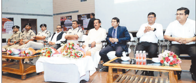
भारतीय न्याय संहिता पर कार्यशाला में उपस्थित अतिथि।

आगामी 1 जुलाई 2024 से लागू हो रही नवीन कानून संहिताओं के संबंध में आज नगर निगम ऑडिटोरियम पर पंजीर प्लॉट पर रायगढ़ में भारतीय न्याय संहिता 2023 भारतीय नागरिक सुरक्षा संहिता 2023 और भारतीय साक्ष्य अधिनियम 2023 पर कार्यशाला का आयोजन किया गया है। कार्यशाला में मुख्य अतिथि के रूप में उपस्थित राज्यसभा सांसद देवेन्द्र प्रताप सिंह ने कहा कि सरकार नया कानून ला रही है जिससे जनसामान्य को त्वरित न्याय मिलेगा वहीं अपराधियों को भी जल्द सजा मिलेगी। उन्होंने कहा कि अंग्रेजों के जमाने से चले आ रहे कानून और इसकी धाराओं में किया गया बदलाव 1 जुलाई 2024 से लागू हो जाएगा। इसका उद्देश्य आम जनता को त्वरित रूप से न्याय दिलाकर राहत प्रदान करना है। इस लिए नवीन कानून के बारे में हर सभी लोगों को जानकारी होना बहुत आवश्यक है। राज्यसभा सांसद श्री सिंह ने कहा कि अपराधियों के लिए नए कानून में गंभीर सजा एवं समाज को अपराध मुक्त बनाने के लिए कड़े प्रावधान हैं। उन्होंने कहा कि अब सारे रिकार्ड ऑनलाईन और